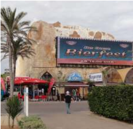
Unser zweites Zuhause, der Megapark

Für die meisten klang der gehaltvolle Tag in irgendeiner Disco oder einem Biergarten aus, ein bisschen später vielleicht als an den anderen Abenden, da ja am nächsten Tag der wohlverdiente Ruhetag angesagt war.