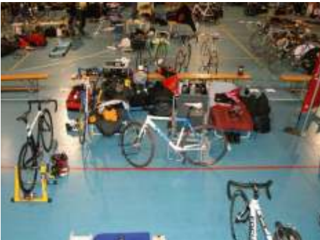
Unser Lager im Velodrom

Zum Glück für uns „Rookies“ waren nur 22 Teams am Start, anstatt den gemeldeten 36. Je mehr Fahrer, desto hektischer und nervöser wird gefahren und dies bedeutet Sturzgefahr.