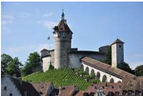
Der Munot; das Wahrzeichen von Schaffhausen

Die Altstadt weist zahlreiche Renaissancegebäude auf. Den Beinamen Erkerstadt bekam Schaffhausen aufgrund der 171 vorhandenen Er-